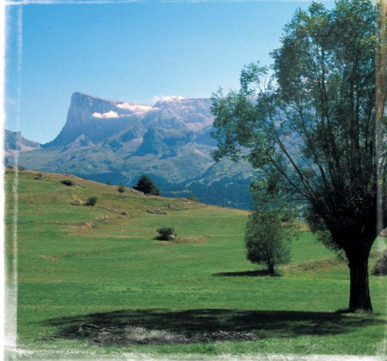
Pic de Bure

Ces 4 sources sont l'exutoire d'un réseau d'eaux souterrain. Les Grandes Gillardes sont la deuxième résurgence de France par leur débit, jaillissant d'un chaos d'énormes blocs dans le défilé de La Souloise, site d'une beauté exceptionnelle ! Durée : 4 à 5h. Accès, départ : St-Disdier, Pont sur la Souloise, parking des Gillardes (Vs Dévoluy).