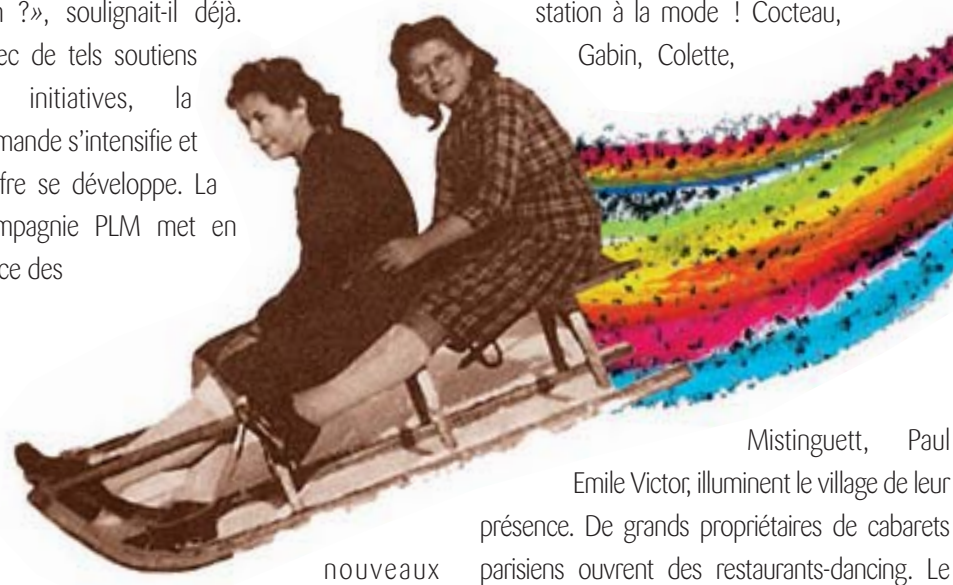
Mistinguett, Paul Emile Victor, illuminent le village de leur présence. De grands propriétaires de cabarets parisiens ouvrent des restaurants-dancing. Le