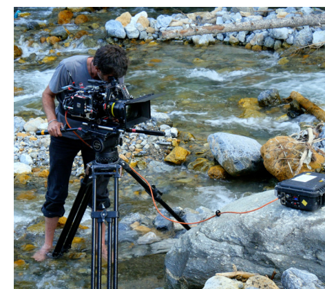
Tournage «Alex Hugo»

Bureau d'Accueil des Tournages ALPES French South Agence de Développement, 13 avenue Maréchal Foch 05002 GAP bat@hautes-alpes.net 04 92 53 62 00 www.filmalpes.net