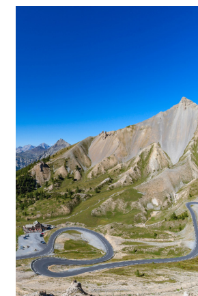
Col de l'Izoard