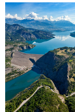
Lac et barrage de Serre-Ponçon