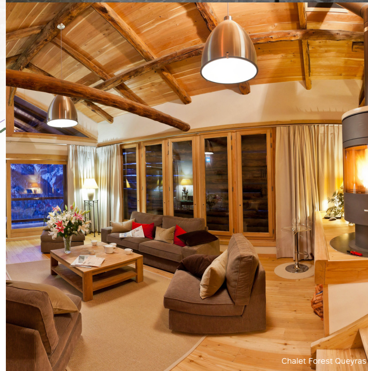
Chalet Forest Queyras