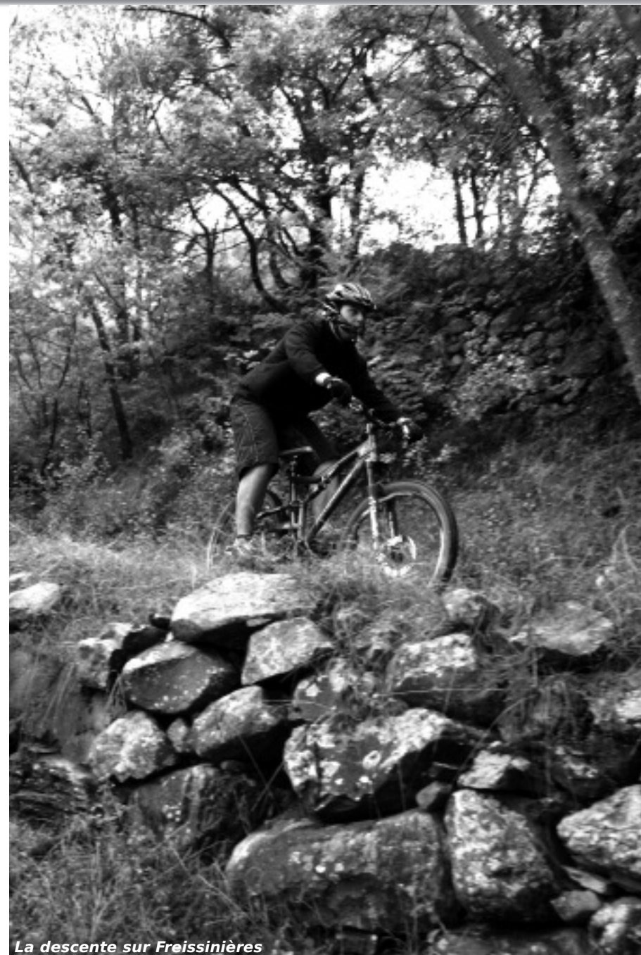
La descente sur Freissinières

(2 : 1362 m – 16,3 km) Aller en direction du col d'Anon par la piste qui monte. La montée est très raide. Arriver à un embranchement, prendre à gauche la piste qui monte au lac des Lauzes. Selon la saison, il peut être à sec. Passer au dessus du lac.